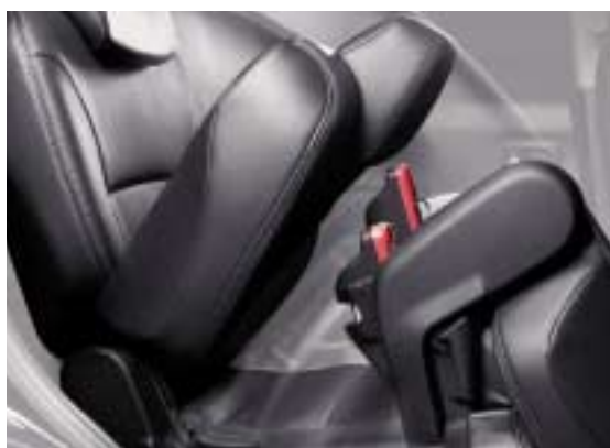
Stražnja klupa se preklapa uz električnu asistenciju.