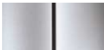
Siva Cool Silver