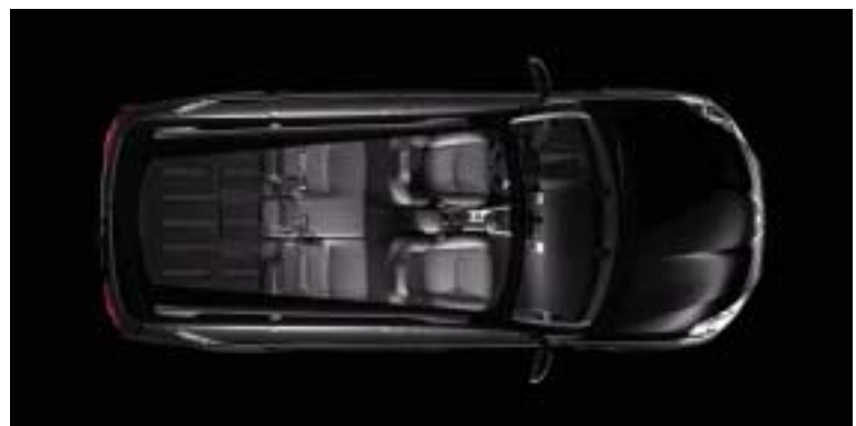
Konfiguracija 5 sjedala

pokretom. Jednako je jednostavno ponovno ih sklopiti, kad se pokaže potreba za dodatnim prostorom za teret.