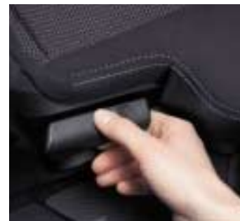
Ručka za preklapanje stražnje klupe.

U slučaju da ni to nije dovoljno, jednostavnim pokretom ruke drugi red sjedala se jednostavno preklapa prema naprijed ostavljajući vam do 1688 l prostora za najveće terete. To je već prostranstvo koje treba istražiti.