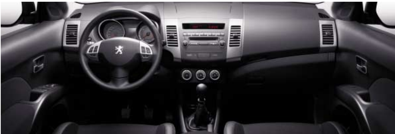
Unutrašnjost nivo Premium