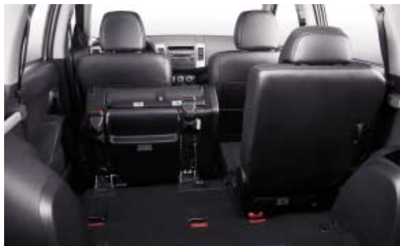
Preklopna sjedala u drugom redu

najviše odgovara. Drugi red sjedala udobno smješta troje, no nudi i mogućnost pomicanja do 80 mm prema nazad, kako bi oslobodio dodatno mjesto za noge putnika u drugom redu. Trebate li prostora za teret? Jednostavno ih preklopite. Želite li povesti još dvoje putnika? Nema problema, u podnici prtljažnika nalaze se još dva preklopna sjedala.