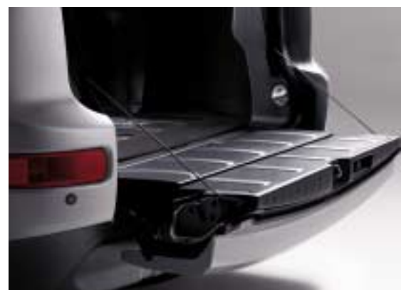
Stražnja preklapna platforma nudi izniman pristup prtljažniku uz potpuno ravan utovarni prag.