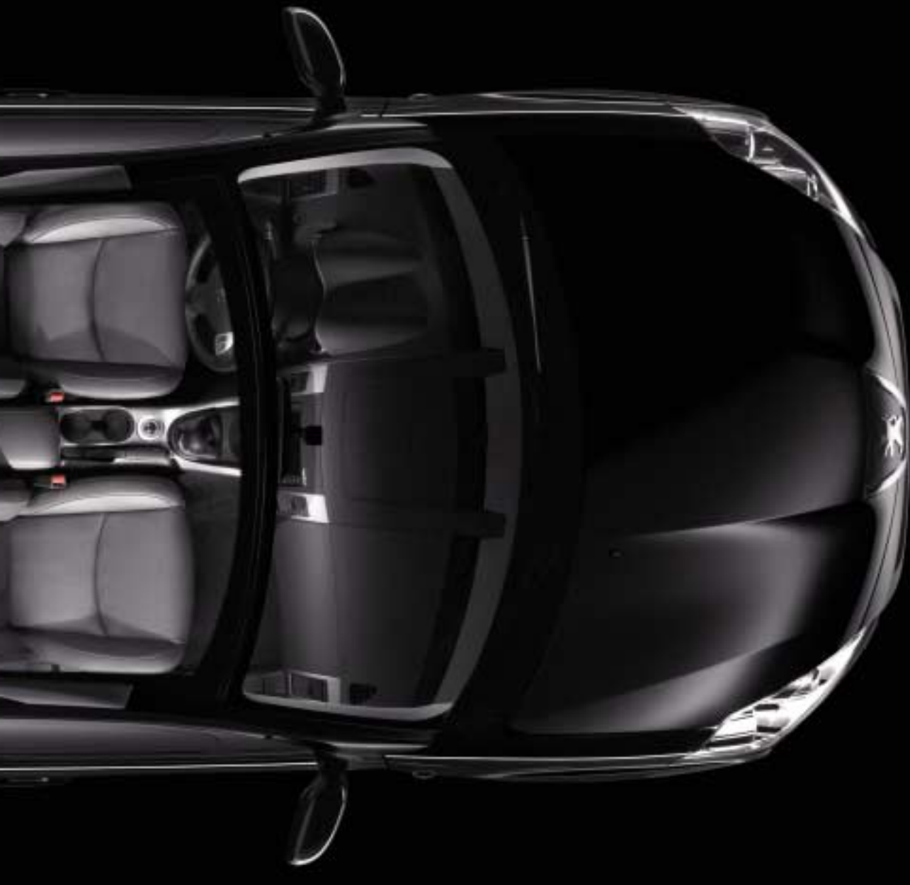
Konfiguracija 7 sjedala