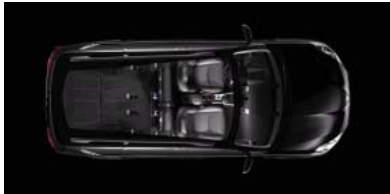
Konfiguracija 2 sjedala