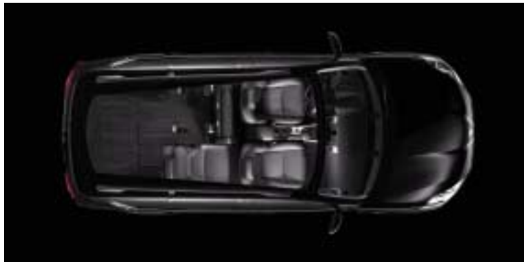
Konfiguracija 3 sjedala