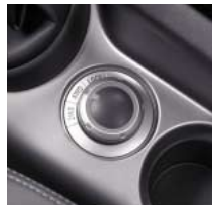
Komanda integralnog pogona.

Snijeg, duboko blato ili pijesak? Tu je blokada centralnog diferencijala koja pruža dodatnu prijanjanje na podlogu u trenucima kad vam je to najpotrebnije, pogotovo pri malim brzinama.