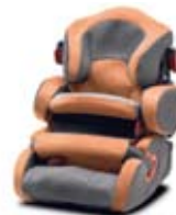
Kiddy Life + Grupa : 1, 2, 3 Navedeni model Grupa 1 sa zaštitom prodaje se odvojeno.