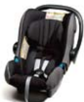
Romer Baby Safe + Grupa : 0

Ponuda sjedalica prilagođena prijevozu djece već od prvih dana pa sve do 10. godine života, kako bi im se pružila zadovoljavajuća udobnost. Testirane i homologirane, zadovoljavaju najstrože sigurnosne standarde (europska homologacija ECE R44/03).