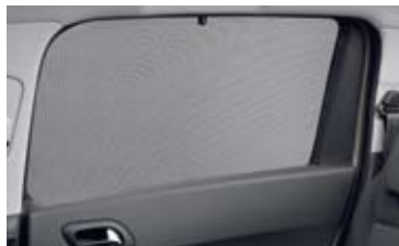
Bočna zavjesa za zaštitu od sunca

Skrojena po mjeri, poboljšava zaštitu putnika od sunčevih zraka zamračujući stakla stražnjih vrata.