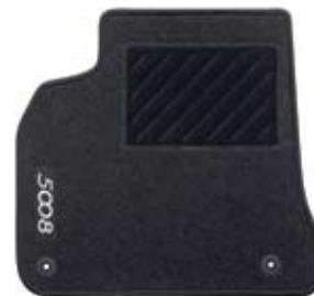
Podna prostirka od tkanine