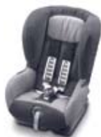
Isofix 3 točke Romer Duo + Grupa : 1