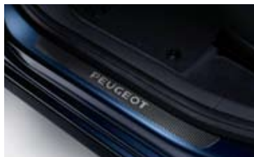
Zaštite praga vrata s izgledom karbona

Bilo od PVC materijala s izgledom karbona bilo od inoksa, zaštite praga vrata 5008-ice spajaju estetiku i zaštitu donjeg dijela gazišta.