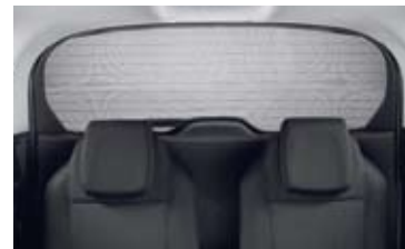
Stražnja zavjesa za zaštitu od sunca