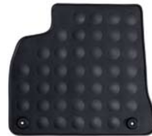
Gumena podna prostirka