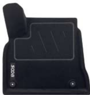
Oblikovana podna prostirka