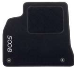
Podna prostirka od baršuna