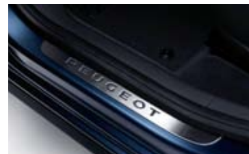
Zaštite praga vrata od inoksa