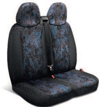
Boxer - Presvlaka Lombo

Za dodatne informacije posjetite svoje prodajno mjesto.