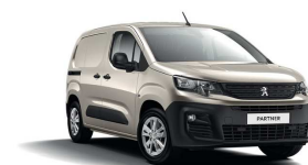
EUM0 - Siva SABLE