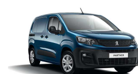
JGM0 - PLAVA NUIT