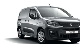
F4M0 - SIVA ARTENSE