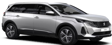
Bijepa Perla Nacre