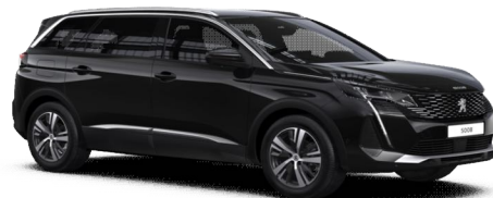
Crna Perla Nera