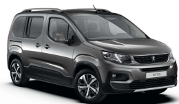
VLMO - SIVA PLATINUM