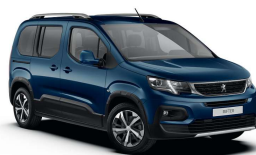
JGM0 - PLAVA NUIT