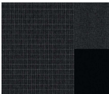
ODFY - Tkanina "Squared"