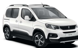
PRP0 - BIJELA ICY