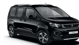
9VM0 - CRNA PERLA NERA